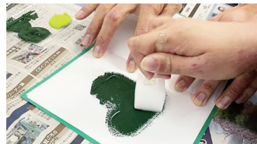
靴下の型紙でポンポンしている様子